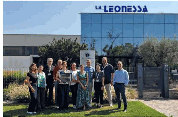
A Carpenedolo La Leonessa ha ottenuto un importante riconoscimento da Caterpillar

Questo, in un contesto in cui il gruppo che fa riferimento alla spa di Carpenedolo, attivo nella produzione e commercializzazione parti meccaniche per uso industriale e agricolo (nello specifico produzione di cuscinetti base, ralle di sterzo a sfera e assali agricoli) - nell'area di consolidamento sono presenti quattro aziende di Carpenedolo La Leonessa spa, Fad Assali spa, F.V. Engineering srl e La Rocchetta srl, cui si aggiungono La Leonessa of North America e La Leonessa Bearings Yancheng Co -, ha chiuso il 2025 con numeri in linea con l'anno precedente: il fatturato consolidato è arrivato a circa 70 mi-